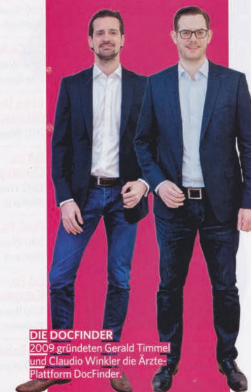
DIE DOCFINDER 2009 gründeten Gerald Timmel und Claudio Winkler die Ärzte- Plattform DocFinder.